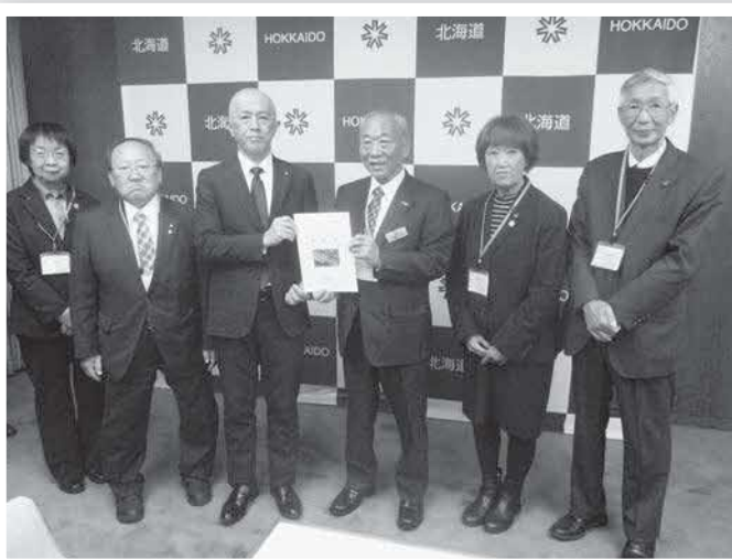
加納副知事（町長左） 要望書手交

本道南部の交通要衝・新幹線と在来線の結節点に位置する長万部町は、高速かつ定時性に優れる新幹線物流を支える最適な拠点として、道内外の物流効率化、産業活性化、そして持続可能な地域社会の形成に貢献できる可能性を有しております。