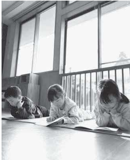
セリフ合わせしようか？

日チェックしては、「発表会まであと〇にちー！」と楽しみにしている子ども達。家族に披露できる日を心待ちにしています。