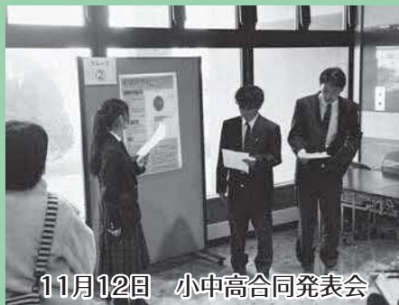
11月12日 小中高合同発表会