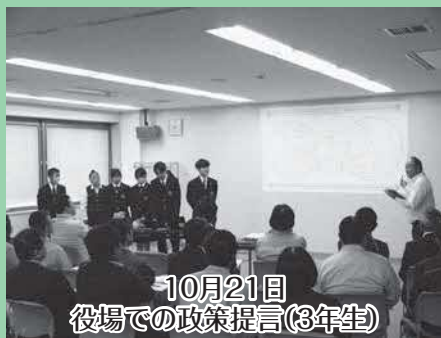
10月21日 役場での政策提言(3年生)