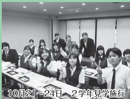
10月21～24日 2学年見学旅行