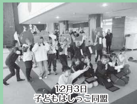
12月3日 子どもはしっこ同盟