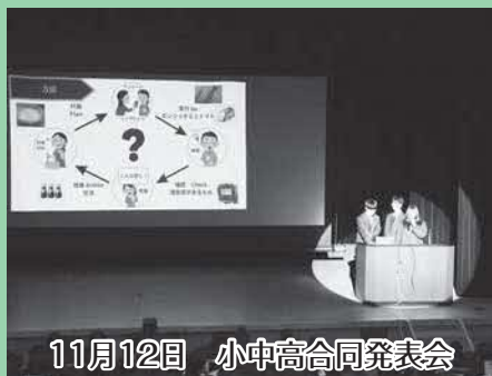
11月12日 小中高合同発表会