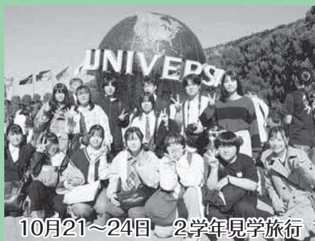
10月21～24日 2学年見学旅行