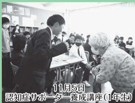
11月5日 認知症サポーター養成講座(1年生)