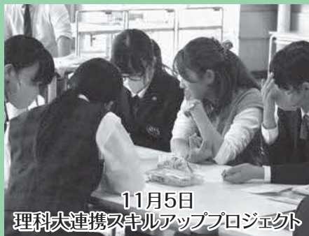
11月5日 理科大連携スキルアッププロジェクト