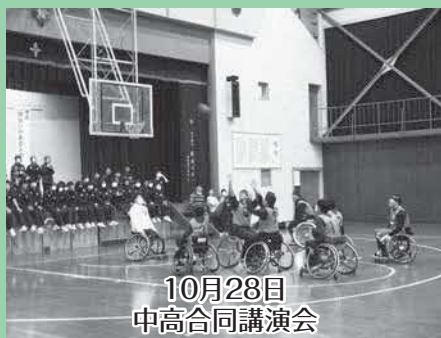
10月28日 中高合同講演会