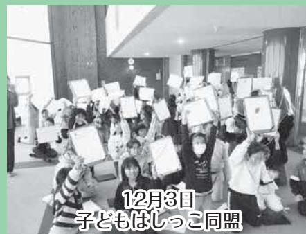
12月3日 子どもはしっこ同盟