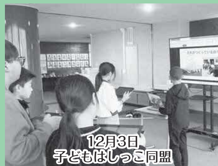
12月3日 子どもはしっこ同盟