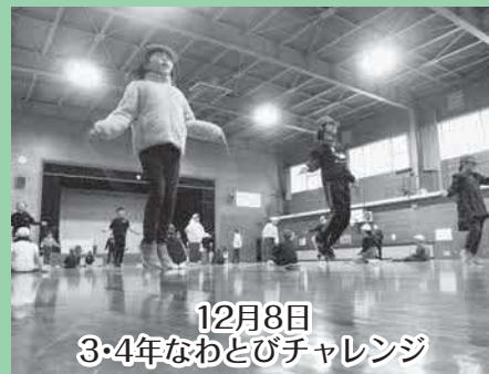
12月8日 3・4年なわとびチャレンジ