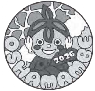
●ピンバッジ デザイン