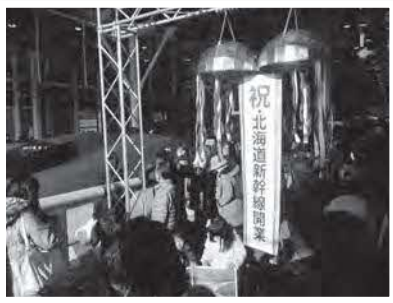
北海道新幹線開業時

イベントでは沿線自治体の魅力を発信するブースや特産品等に関するクイズ、PR品の配布などが行われ、家族連れなどで大変賑わいました!