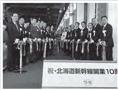
開業10周年記念イベント