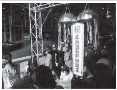
北海道新幹線開業時

イベントでは沿線自治体の魅力を発信するブースや特産品等に関するクイズ、PR品の配布などが行われ、家族連れなどで大変賑わいました!